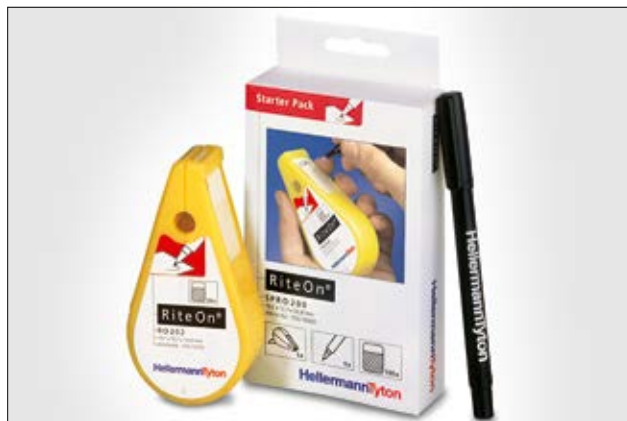
El pack de inicio RiteOn le ayudará a comenzar de inmediato.