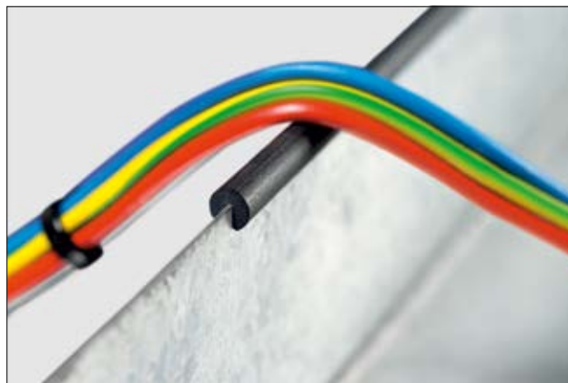
Perfil de protección de cantos EdgeGuard.