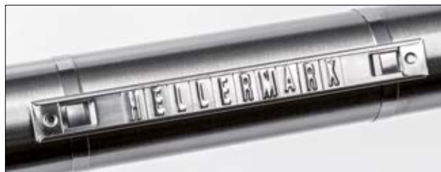
Hellermark SSC i SSM.

Szyldy Hellermark są używane w kolejnictwie, przemyśle okrętowym, wiertniczym, petrochemicznym, spożywczym i budowlanym do oznaczania kabli, rur i innych elementów wykorzystywanych w trudnych warunkach.