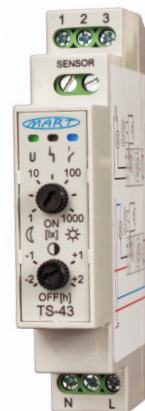
AUTOMAT ZMIERZCHOWY TS-43-4 EKO

Ze względu na ochronę środowiska, nie należy wyrzucać zużytych urządzeń elektrycznych i elektronicznych razem z odpadami komunalnymi. Zużyty sprzęt należy oddać bezpłatnie do punktów zbiórki w celu recyklingu. Wszelkie informacje na ten temat można otrzymać u sprzedawców, dystrybutorów, producenta lub w internecie. Opakowanie wyrobu wykonane jest z materiałów ekologicznych. Taśma pakowa z PCV będzie wykorzystana do wyczerpania zapasów.