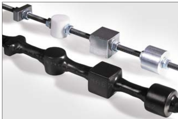
Gracias a su alto grado de contracción, HA67 es idóneo para el aislamiento en formas y dimensiones muy complejas.