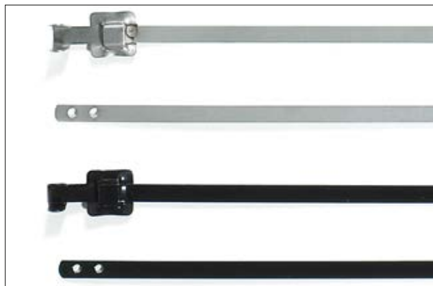
Seria MLT. Stalowe opaski rozpinalne są dostępne w wersji bez i z powłoką izolacyjną.