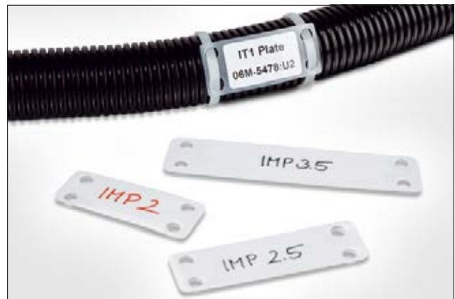
La meilleure solution pour identifier les câbles et tuyauteries de tout diamètres.