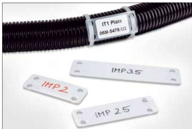
Cables de cualquier diámetro pueden ser identificados.