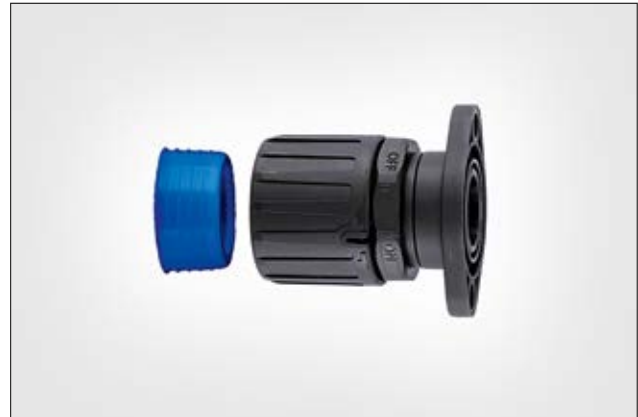
HelaGuard HGL-SFL gerade, drehende Flanschverschraubung mit Schlauchdichtung.