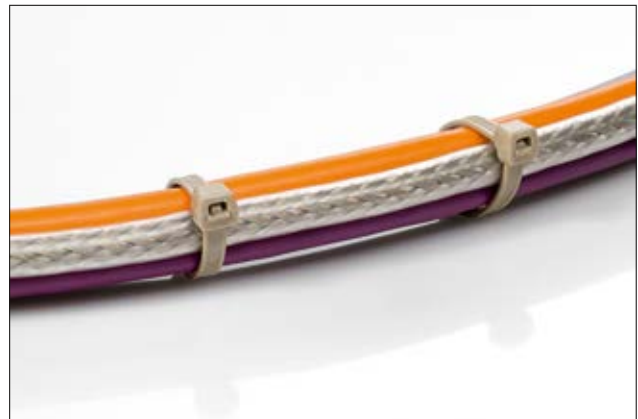
Su cabezal contorneado ocupa menos espacio, ofreciendo a su vez una baja fuerza de inserción pero con una alta resistencia.