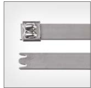
Bridas de Acero Inoxidable MBT_XHS, sin recubrimiento.