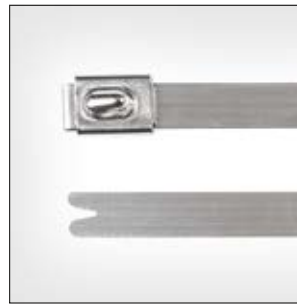
Bridas de Acero Inoxidable MBT_SS, MBT_HS, sin recubrimiento.