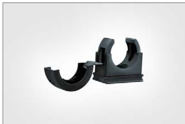
HelaGuard PACC, clip pour gaines annelées.