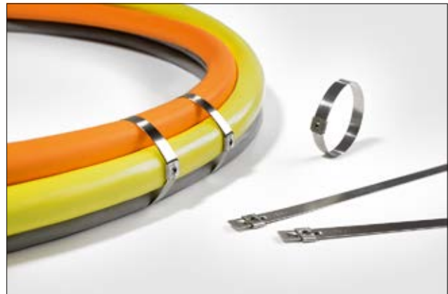
Bridas de acero inoxidable Serie MST.