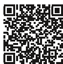
Vídeo de aplicación: Serie MST