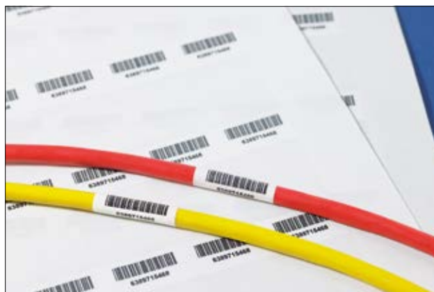
Zalaminowanie oznaczenia zapewnia długą trwałość nadruku.