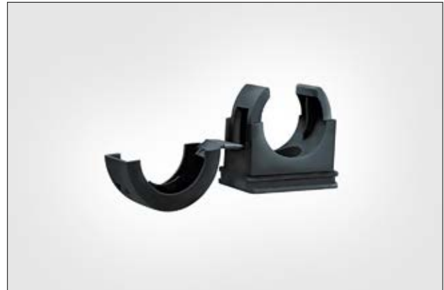
HelaGuard PACC Befestigungsschelle.